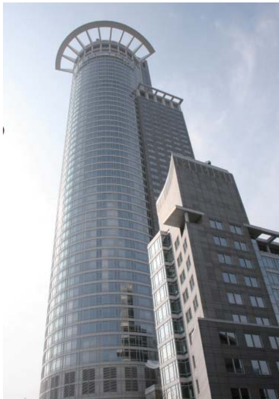
德国 DZ 银行

为帮助欧盟中小企业应对欧债危机，欧盟委员会于 2011 年底与欧洲投行签署合作协议，扩大欧洲投行现有的风险投资基金规模，帮助欧盟创新型中小企业在研发领域获得融资贷款。欧洲投行下设的风险投资基金主要是帮助欧盟创新型中小企业或在研发领域获得项目贷款。迄今为止，该基金已通过欧洲投行的渠道向约 100 家中小企业或机构提供总额约为 100 亿欧元的研发项目贷款。根据双方达成的合作协议，欧洲投行计划在今后两年中向欧盟中小企业提供总额为 60 亿欧元的研发贷款，以扶持欧盟中小企业在技术创新领域的发展。