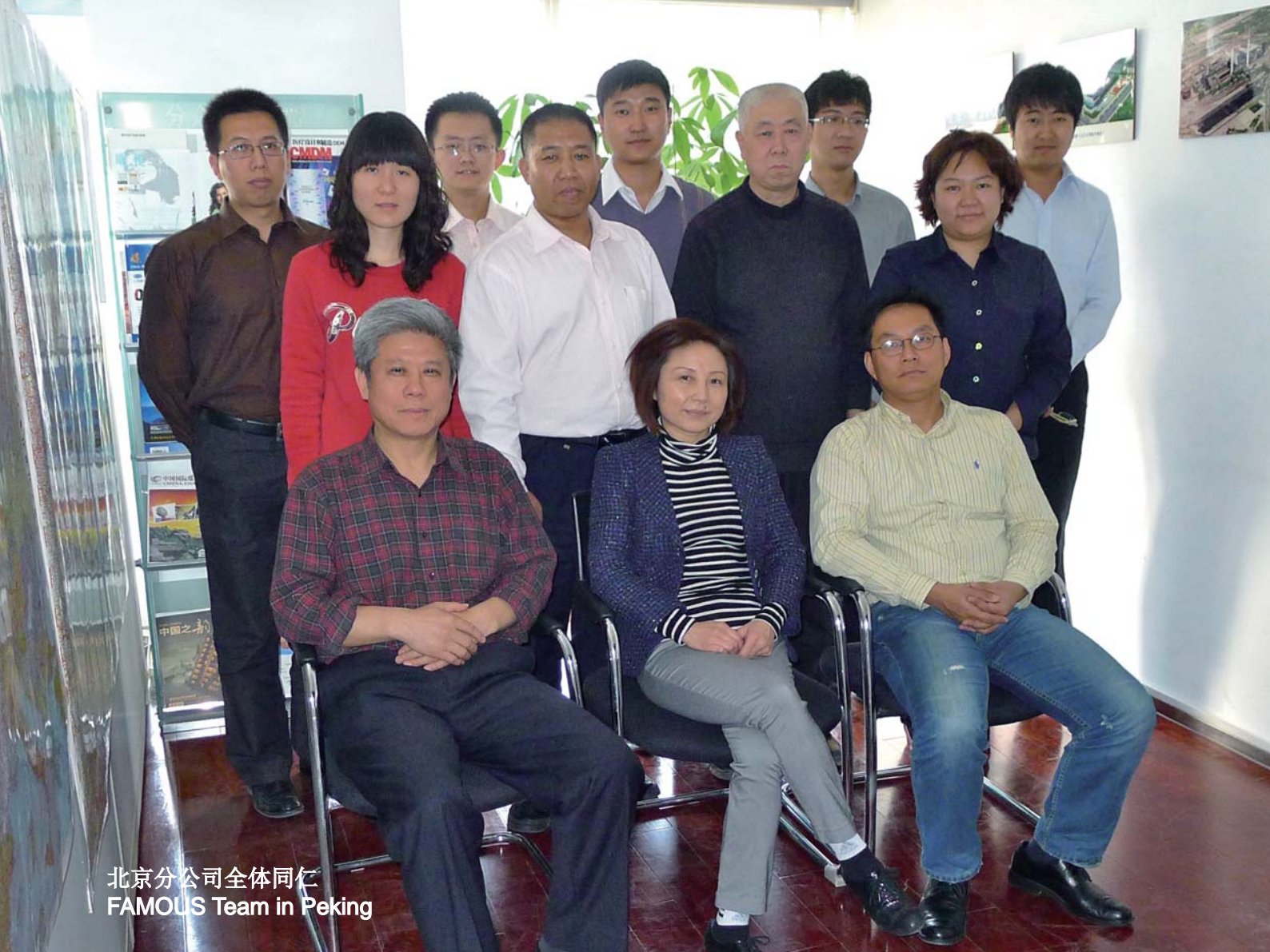
北京分公司全体同仁 FAMOUS Team in Peking