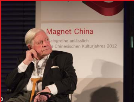
德国前总理施密特出席“磁力中国”中德对话开幕式