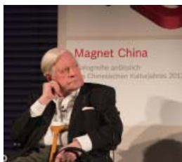
05 德国前总理施密特先生