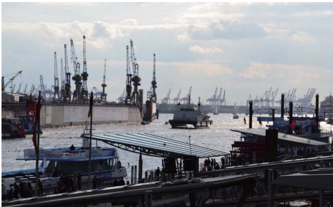
汉堡港——德国最大的货运港口