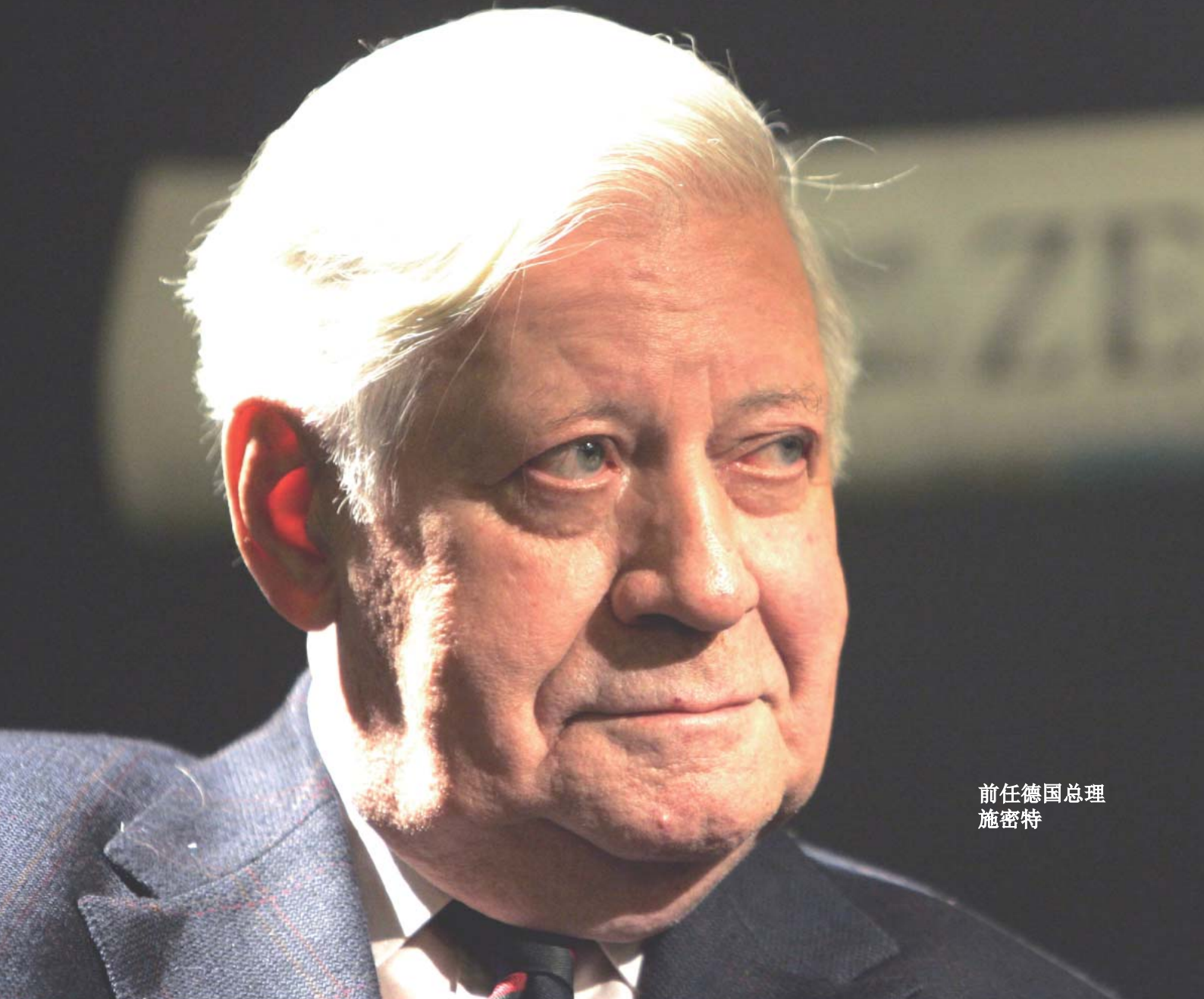
前任德国总理 施密特