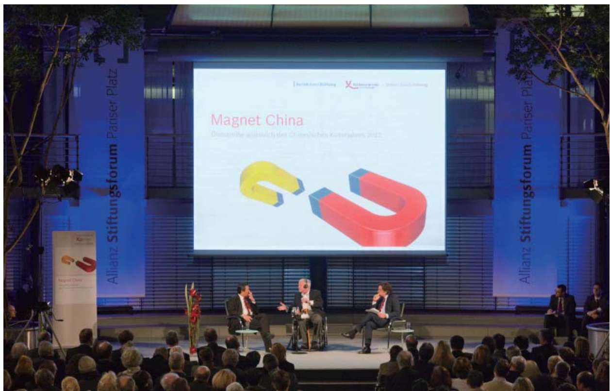
“磁力中国”活动正式开幕对话