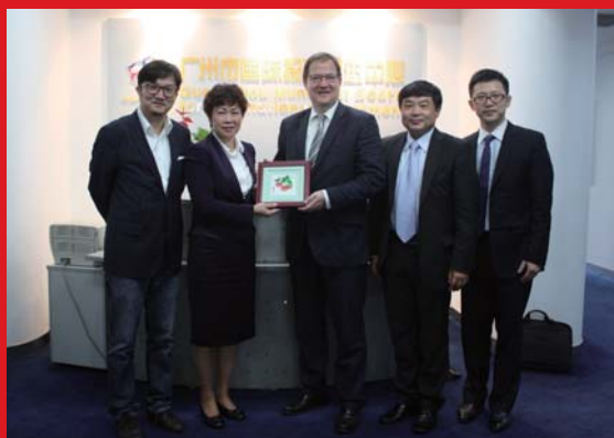
德国泰乐信律师事务所拜访广州市国际投资促进中心