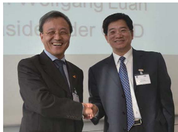
飞马集团与招金集团签署合作协议