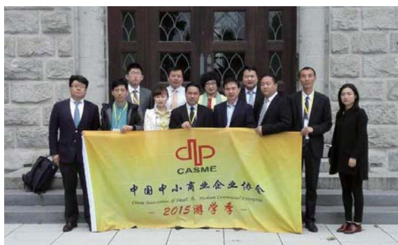
参访团拜访中国驻法兰克福总领事馆经商室