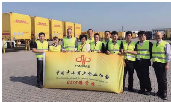
参访团在德国物流集团DHL参观和交流