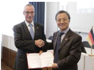
10 工商会召开全体会员大会