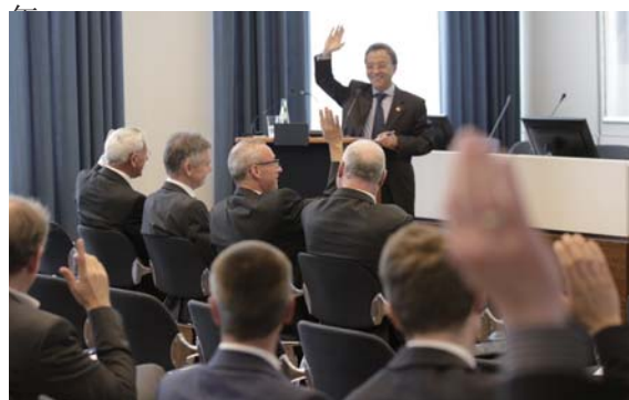
到会会员一致通过大会决议，选出新任会长和副会

国际煤炭技术装备论坛，50 多家中国煤业集团公司到会参加活动。同时，工商会还组织了中国企业收并购论坛，邀请了近年来在德收并购的中国企业共同探讨收并购前后所遇到的问题。2014 年和 2015 年，由飞马集团控股公司赞助了“飞龙杯”中德企业家高尔夫球邀请赛。会员大会之后举办的 2015 中德高层经济论坛也是今年德国中国工商会组织的重要活动之一。除此之外，在这五年中，工商会先后成功地为其会员单位提供了业务上的支持并成功合作，如：鲁尔矿山集团与中国国投新集能源股份有限公司；WAT 公司在几年内向中国销售了七十多台降温设备；GTA 与安徽淮北及淮南矿务局；德国著名的建筑事务所 RKW 与安徽宣城市；戴尔曼哈尼尔公司也通过工商会的介绍向中国销售了几千万欧元的产品；贝克矿山机械集团向中国销售了几千万欧元的设备；位于 Witten 的 Neuhaus Galade 与中国淮北市取得了业务上的联系；翻译公司 Intermundos 通过工商会得到了德国客户的委托合同；鲁尔集团与安徽淮南市签署了瓦斯治理合作协议。此外，通过工商会的咨询和协助，PTG 精密技术贸易公司避免了来自中国的一起贸易诈骗事件，杜塞尔多夫建筑事务所也同样通过工商会避免了来自云南昆明的一起贸易诈骗事件。工商会对会员单位诸如此类的支持，不胜枚举。截至 2015