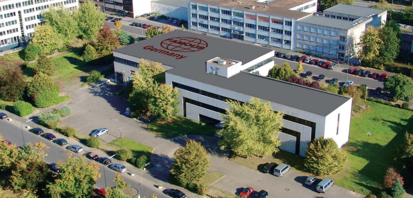
Geschäftsgelände von FAMOUS in Düsseldorf 德国飞马集团公司位于德国杜塞尔多夫市的办公大楼