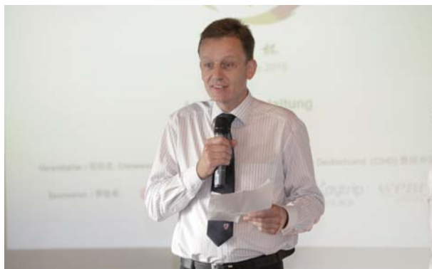
拉廷根市副市长 Rainer Vogt 先生致辞