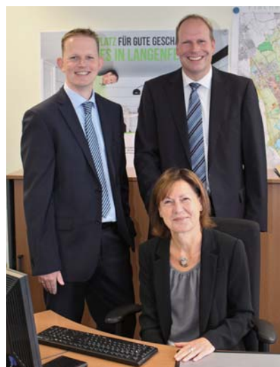
朗根费尔德市经济促进局中国事务团队