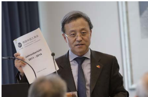
栾会长向会员企业作年度总结报道

年8月为止，工商会的会员企业主要来自机械制造、汽车零部件、电子、物流、贸易及税务法律等行业。仅今年以来，工商会就增加了三家新的会员单位： Hoffmann Liebs Fritsch 律师事务所、 Faber&Faber 人力资源服务有限公司及韦伯珠宝钟表有限公司。