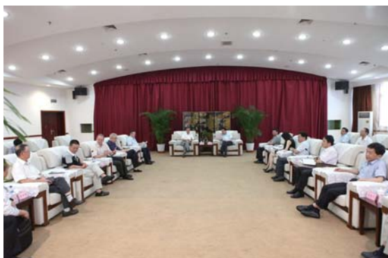
栾会长与黄山市市长孔晓宏会谈

应黄山市政府的邀请，德国中国工商会会长栾伟一行于6月25日至27日对黄山进行了访问。