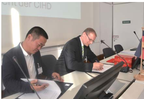
飞马投资与大地熊，德国中国工商会与中国中小商业企业协会分别签署合作协议