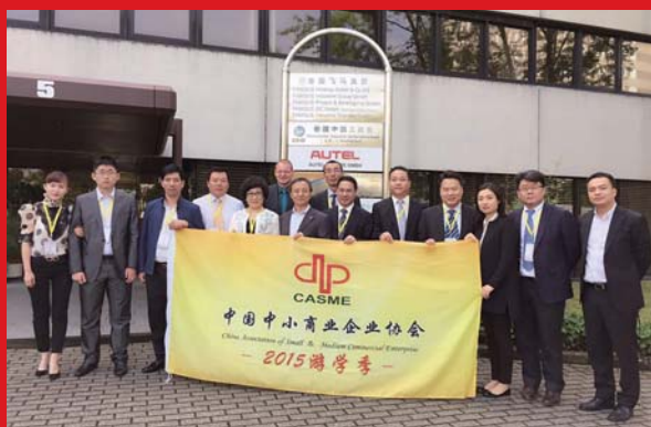
中国中小商业企业协会代表团作客工商会