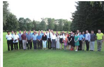
18 “飞龙杯” 高尔夫球邀请赛