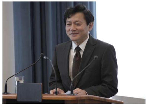
冯海阳总领事在活动上致辞

在论坛最后环节，德国中国工商会与中国中小商业企业协会、德国飞马控股集团有限公司与招金集团有限公司、德国飞马投资有限公