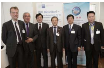
08 2015 中德高层经济论坛圆满落幕