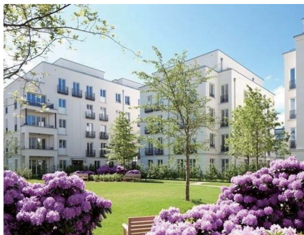
杜塞尔多夫的海涅花园等上千套新楼盘都是由壹亩房置业直接代理，无中介费。

那您是否能提高房租呢？只要有合理的理由，是可以提高房租的。比如您可以利用政府的数据说这几年水电费、物业管理费或者地区平均租金涨了，那就可以要求加租金。至于租客答不答应就要协商了。对于加租的频率和幅度德国也都有法律规定。比如说，在房客入住满一年后才才可以要求加租，3 年内的租金不能上涨超过 20% 左右（某些城市的幅度更低）。最好就是在签购房合同前，让前房东要求房客加租。