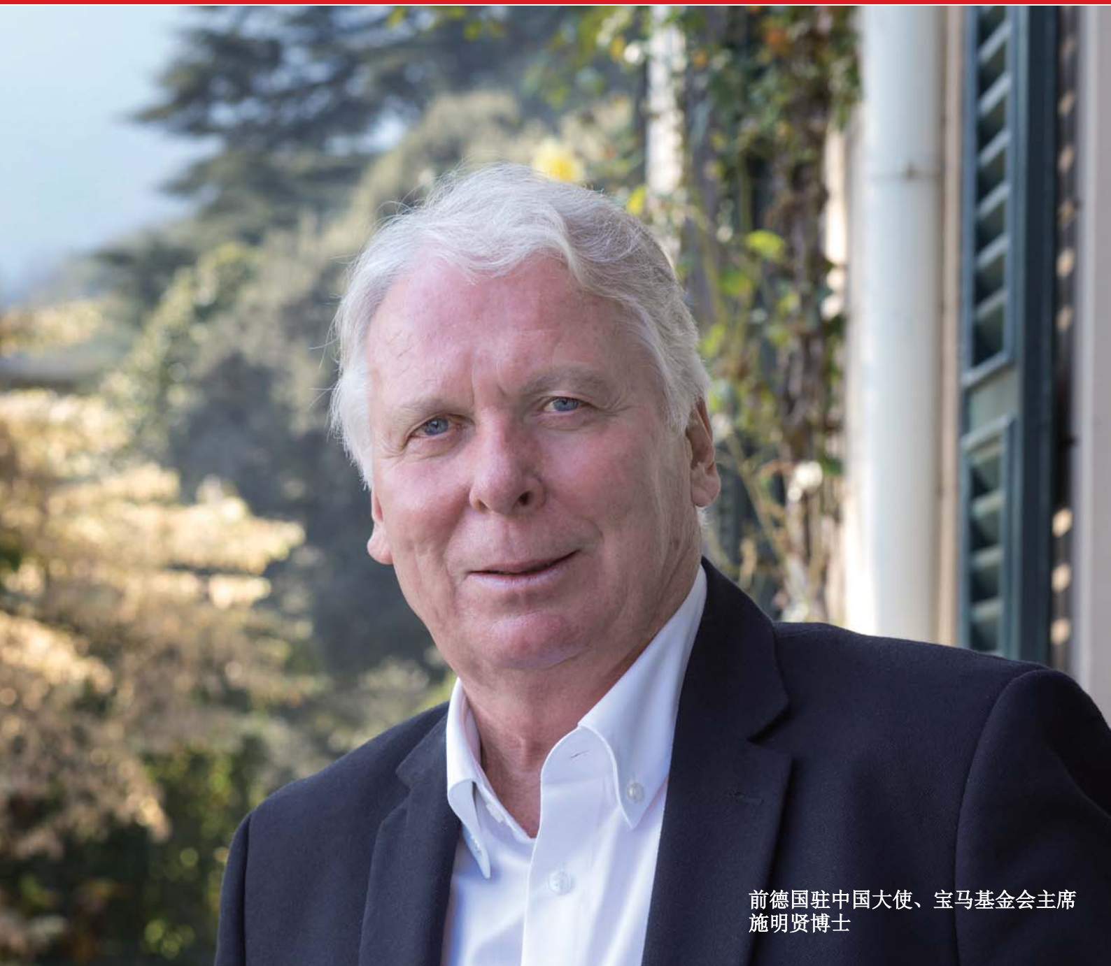
前德国驻中国大使、宝马基金会主席 施明贤博士