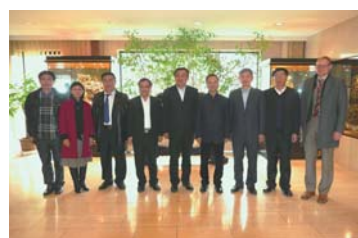
23 中国煤矿科工集团代表团