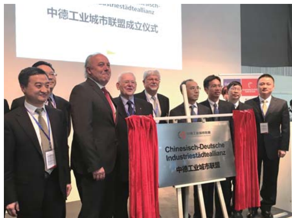
右：2016年4月25日，德国经济部国务秘书马赫尼希与中国驻德国大使李晓驷公使出席中德工业城市联盟成立仪式