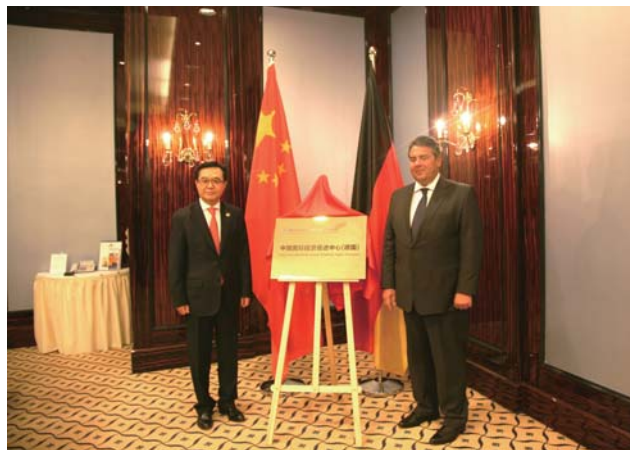
左：2014年10月，中国商务部部长高虎城与德国副总理加布里尔在柏林为投促中心成立仪式揭牌