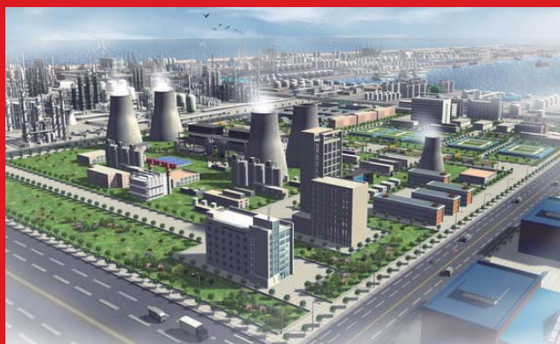
天津经济开发区内的南港工业区